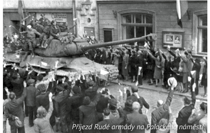
Příjezd Rudé armády na Palackého náměstí