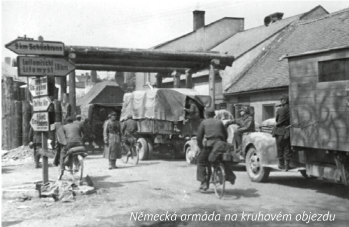
Německá armáda na kruhovém objezdu