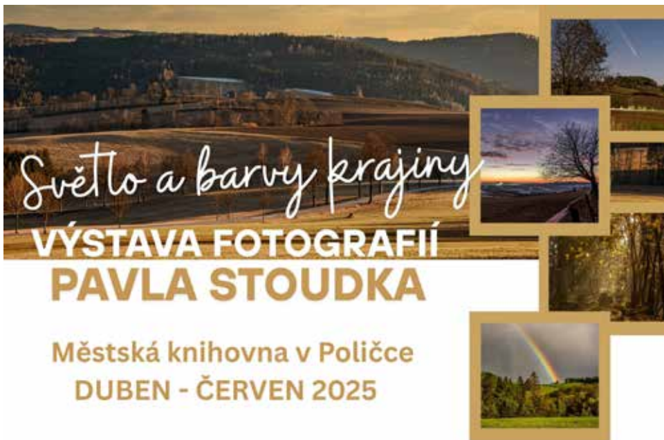
Výstava je přístupná v rámci aktuální otevírací doby knihovny

Přijďte a nechte se vtáhnout do světa pohádek a přírodních tajemství. Skrze hravé úkoly a tvořivé čtenářské dílny vstupte do světa knih, pohádkových postav a komiksových příběhů. Prostor dostanou i komiksové kresby na přání. Přírodovědný výlet do mikrosvěta bude tentokrát inspirován především houbami. A na Půdě se představí známí i méně známí roboti a kultura makers – řezací laser a 3D tisk.