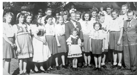
Dožínková slavnost 1945

Okresní školní radou je 5. srpna 1945 vedením