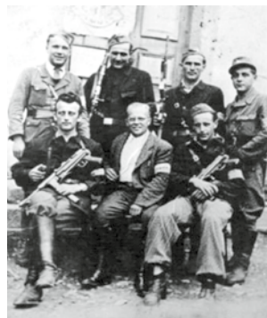
Stráž Národní bezpečnosti v Modřeci květen 1945

Stráž Národní bezpečnosti v Modřeci květen 1945 Druh světová válka skončila 8. května 1945 a pro malou obec 4 km od Poličky nastává velké období změn. Modřec v minulosti patřila do tzv. Hřebečského společenství a byla nejjižnější vesnicí s převážně německým obyvatelstvem. Prakticky celá obec se po roce 1938 přihlásila k německému občanství a zbylé české obyvatelstvo bylo vyhnáno. Před několika lety zde byli na návštěvě původní obyvatelé čp.57, kteří potvrdili, že museli v roce 1938 uprchnout s pár věcmi do Korouhve. Po připojení vesnice k Třetí říši museli mladí němečtí muži z Modřece narukovat k Wehrmachtu a víme minimálně o jednom, který padl u Stalingradu.