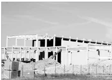
Firma Ravensburger Karton, s.r.o. – výstavba nověho skladu s kapacitou 10 tisíc paletových míst a stavba nové multifunkční haly (stavba vyrůstá vedle současněho sídla firmy)