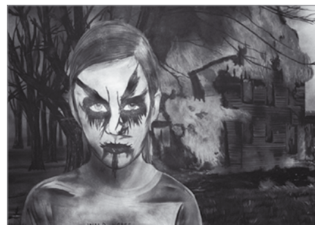
Dívka, která si hrála s ohněm