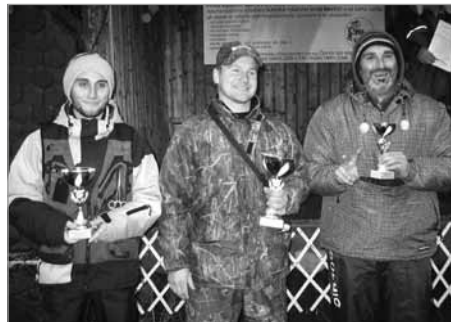
Vítězové hlavní kategorie největší počet ulovených ryb

„Je to závod, kde hlavní roli hrají štika a další dravé ryby jako okoun a candát, o něž je mezi rybáři enormní zájem. To je také hlavní důvod