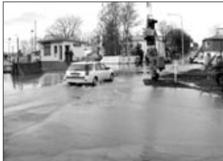
Zaplaven byl také železniční přejezd ve směru na Litomyšl

Poslední naší činností bylo v pátek večer ve 22 hodin vyvyšování přelivové hrany na poldru,