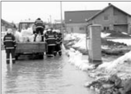
Voda se dostala do lokality Mánesova

Tolik s obavami očekávané tání obrovského množství sněhu ze spádového území (povodí) města Poličky, které činí 31 km 2 , na kterém leželo v podobě sněhu cca 10 mil. m 3 vody, začalo v pondělí 27. března bohužel, tak jako v loni, opět nebyvale intenzivně. Již v noci z pondělí na úterý došlo k naprosto ojedinělé věci, kdy zhruba na ploše 1 km na délku a 30 metrů na šířku došlo na území nad poldrem k situaci, kdy silný proud vody dal do pohybu masu sněhu, a to v podobě dvou metrů vodosněhové vlny. Tato vlna dorazila přesně o půlnoci na hráz připraveného poldru, která tuto vlnu zastavila a tím zažehnala první vážnou krizi.