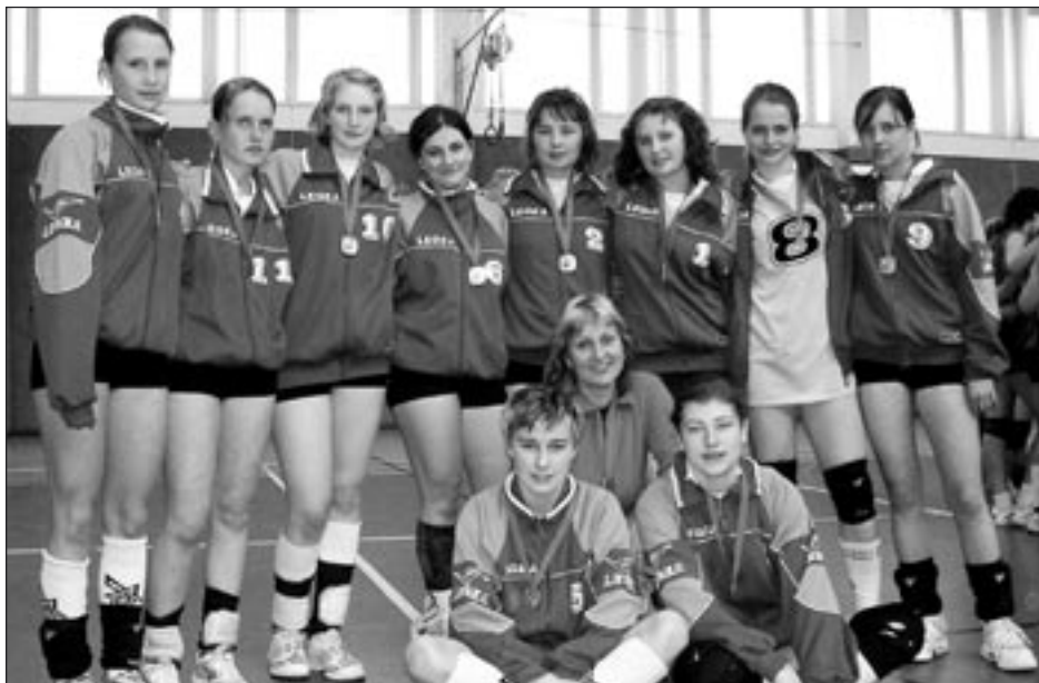
Fotografii se vracíme k článku z červencové Jitřenky. Na snímku jsou kadetky se stříbrnými medailkami za druhé místo v krajském přeboru v sezóně 05-06.

Miloslav Zezula, hlavní pořadatel BTF v Poličce