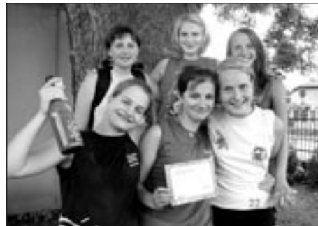
Vítězky Turnaje mládeže – Spartánci

Turnaji opět přálo počasí, sluníčko – až výheň doprovázely každý zápas, prasknutí chladivých rychlých špuntů celý turnaj završilo.