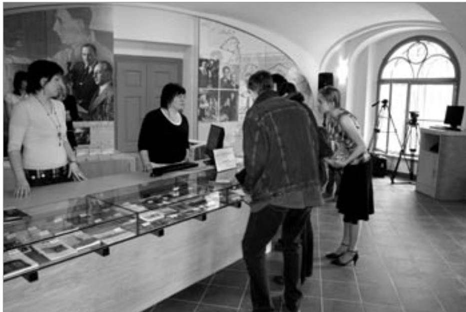
Vstupní hala CBM

Zájemcům doporučujeme předem se objednat na tel.: 461 723 855 nebo na e-mailem na adresu pavla.pavlickova@seznam.cz