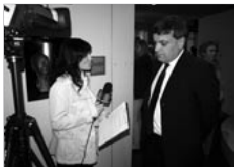
Otevření CBM - starosta při rozhovoru s NTDTV