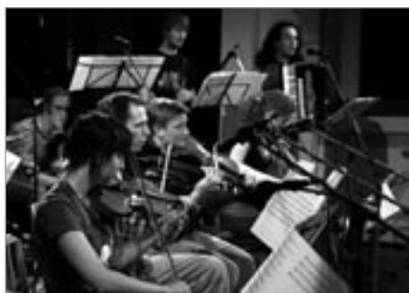
wrgba POWU orchestra