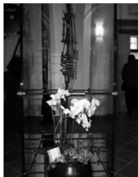
Orchideje - dar holandských partnerů