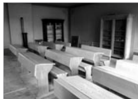
Školní třída Bohuslava Martinů

Výtvarná dílna k výstavě „12 z Poličky“ představí dvanáct vybraných umělců, kteří jsou na výstavě zastoupeni. Program je založen na přímém kontaktu s vystavenými díly, podněcuje představivost, tvořivost i vlastní kreativní práci s různorodými materiály a pomůckami. Vlastní výtvarnou činností a prostřednictvím různorodých aktivit se účastníci programu seznámí s tématy, technikami a postupy, které ve své tvorbě umělci uplatnili. Program je založen na skupinové i individuální tvořivé práci a komunikaci.