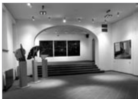
Výstavní sál CBM