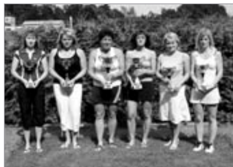
Mistrovství Pardubického kraje - ženy

V sobotu 1. 8. se na poličských kurtech za krásného počasí konalo Mistrovství Pardubického kraje neorganizovaných tenistů. Turnaje se zúčastnilo 44 hráčů