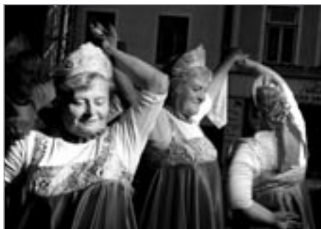
Mažoretky z Horní Lhoty

snad ozdravně. Leč nebylo nám přáno a k lítosti musím napsat, že každé představení, které má po Čechách úspěch a dává handicapovaným hercům pocit souznění a porozumění, tentokrát nemohl bohužel plně vynít. Pro úplnost – později bylo diváků k padesátce a ve Voličské kampani spolupracují herci z pražských divadel a Karlových Varů.