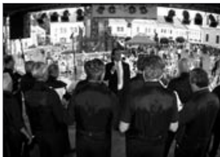
Mužský sbor Hohenems

Jestliže mi loni nebralo na pohodě vpravdě zimní počasí a deštivá slota, letos jsem si s tisíci účastníky užíval nádherného letního času.