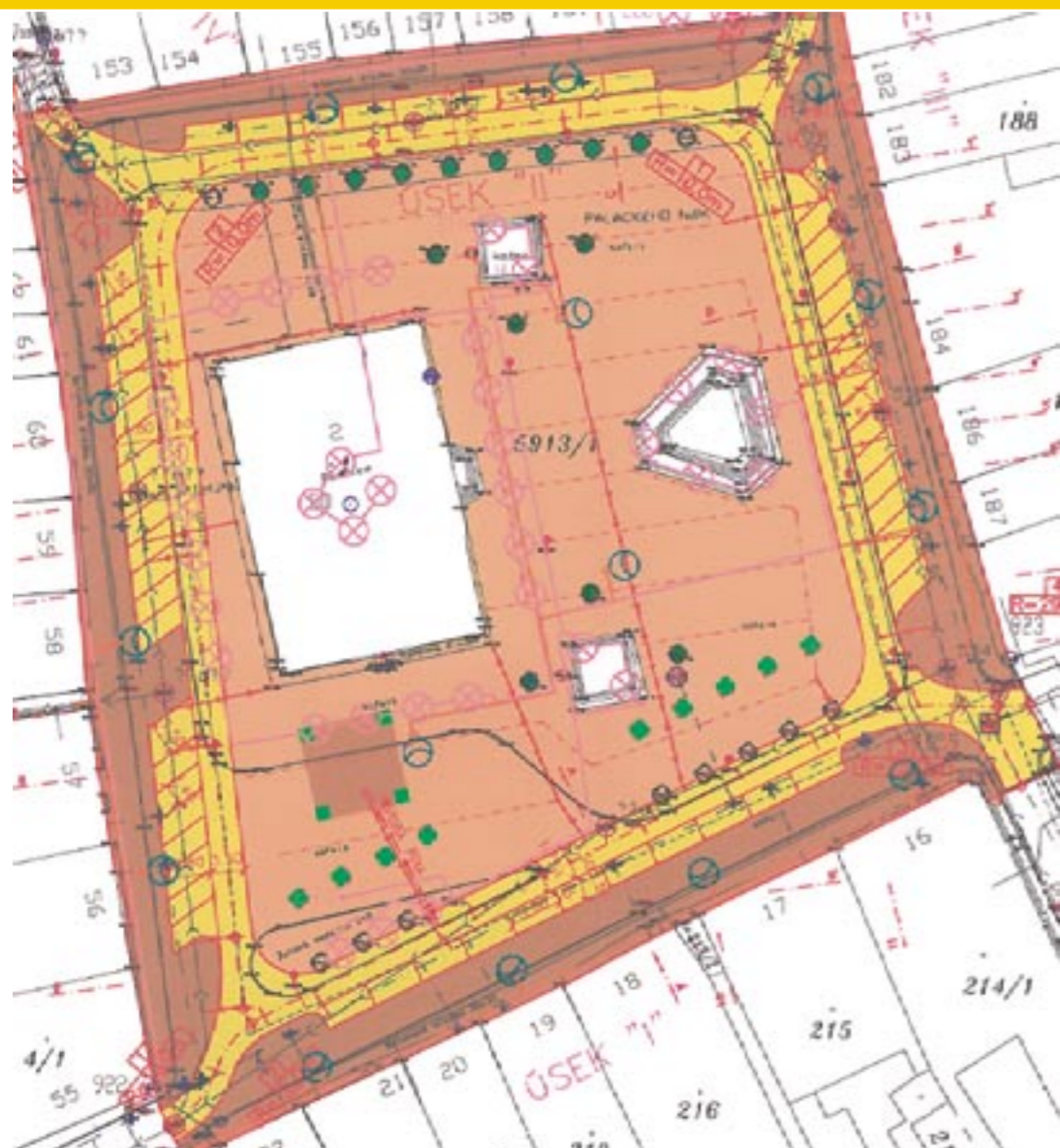
Situace po celkové regeneraci náměstí (konečná podoba)

Při realizaci dojde ke zmenšení této části náměstí (o 3,5 m ze strany od České spořitelny a.s., o 1,5 m ze strany od restaurace Pivovar, proměnlivě o 1 – 4 m ze strany od prodejny Vesna). Prostor, o který je zmenšována středová část náměstí, bude dočasně doasfaltován s napojením na stávající okružní komunikace. Dojde ke zrušení parkoviště pod radnicí – toto bude nahrazeno podélným a šikmým parkovacím stáním podél parteru (viz. situace). V prostoru stávajícího parkoviště bude zhotoveno odpočinkové místo se stromy, lavičkami a pítkem.