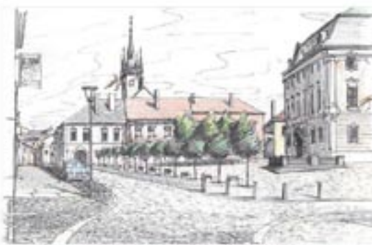
Konečná podoba náměstí po celkové rekonstrukci