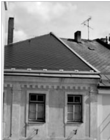
Nová střecha na budově MŠ Palackého nám.

V úvodu nového školního roku informujeme o akcích, jejichž cílem je zlepšit komfort dětí navštěvujících poličská vzdělávací – a související – zařízení. Z městského rozpočtu bylo investováno 7 milionů.