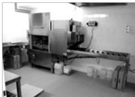
Nové technologie v ŠJ Rumunská

pokr. ze str. 1 etapa výměny oken v areálu Speciální základní školy. Byla provedena v červenci (zhotovitel: firma IPAK s. r. o.) a z městského rozpočtu byla na její realizaci uvolněna částka 195 tisíc Kč. Se začátkem nového školního roku se rozběhla výstavba dětského hřiště v areálu ZŠ Masarykova