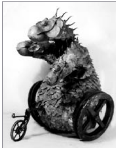
Vítězný výtvor Kolotáč drkotáč