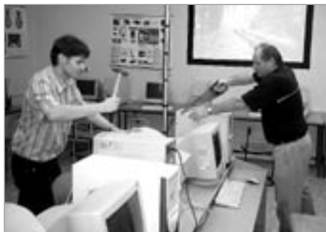
Učitelé ze ZŠ Na Lukách se chystají zásadním způsobem změnit hardware počítačů

Tak nějak by se mohla nazvat taková tichá softwarová revoluce, která ve škole na podzim proběhla. V počítačové učebně totiž byly nainstalovány nejnovější Windowsy jménem Vista.