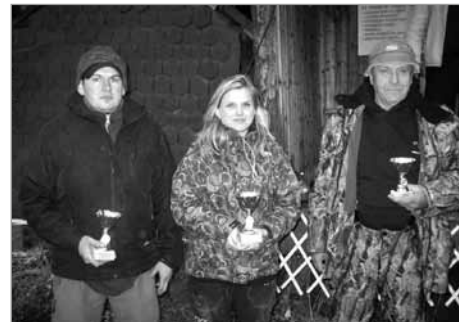
Vítězové kategorie největší ulovená ryba

velké účasti, tím spíš, že se v poslední době jedná o ryby, kterých je na trhu nedostatek. Už to naznačil i předchozí závod, 14. ročník poháru Poličský candát, kterého se zúčastnil největší počet závodníků v historii našeho sdružení (363). Dnes jich tady je 166 (o 60 víc než loni), přijela i početná skupina přátel ze Slovenska. To nás pochopitelně těší a o to větší máme radost, že se nám podařilo, především díky nadstandardním vztahům s naším obchodním partnerem, nakoupit 300 štik. Dále jsme vysadili pstruhy duhové, okouny a omezené množství candátů, celkem 1 500 ryb. Dost jich zde zbylo i po Poličském can-