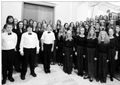
Pěvecký sbor Gymnázia Polička

Večer bylo toto výročí zahájeno ústy starosty, jenž drží v ruce klíč k tomuto staroslavnému městu. A pak před plným hledištěm Tylova domu zazněly tóny i verše Orffovy kantáty, napsané před osmdesáti lety. První oddíl z pětadvaceti je posluchačům melodicky znám a jeho zvláštní rytmický a kano-nický přednes se dá snad vyjádřit postřehem: Je