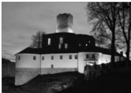
Slavnostní osvětlení hradu

Akci realizovalo město Polička za finančního příspěvní Nadace ČEZ. Osvětlení bude užíváno zejména při slavnostních příležitostech, státních svátcích či při pořádání kulturních akcí v areálu hradu. Oficiální spuštění osvětlení hradu proběhne v sobotu 10. prosince v 16.00 hodin.