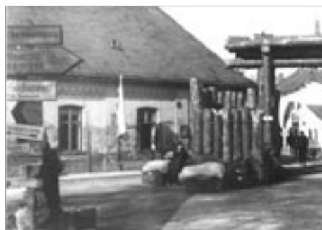
Hostinec U Tmějů v posledních hodinách války