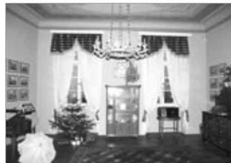
Vánoce na hradě