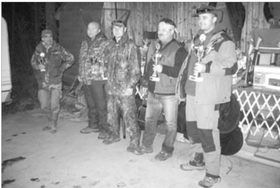
5 nejlepších závodníků-vítěz první zprava, další směrem doleva až k 5. místu viz konečné výsledky

víc štik než byla žádná maličkost. Podařilo se nám to jen díky nadstandardním vztahům s dodavatelem, od nichž jsme jich koupili 1 200, což je největší počet ze všech dosavadních ročníků. Velice solidní je i jejich průměrná váha. O tom, že berou, svědčí fakt, že během prvního kola jich bylo chyceno 550, ve druhém 250. Znamená to 800 štik za dvě hodiny čistého času, což se nevidí každý den.