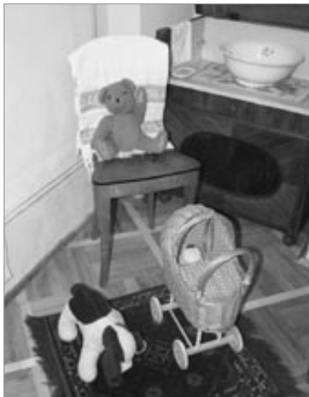
Dětský koutek v ložnici

Tak jako každý rok po úspěšné sezóně i letos došlo k pořízení nových exponátů do interiérové instalace hradu Svojanova. V uplynulém měsíci bylo do pokojů v 1. patře paláce umístěno několik