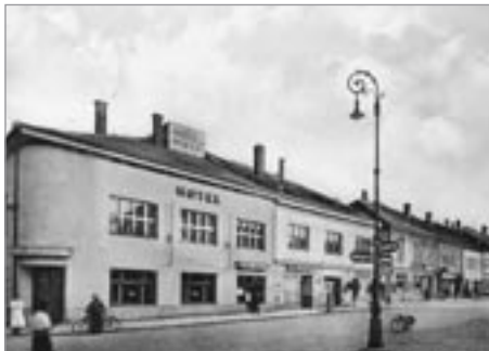
Pohlednice – Hotel Holý na náměstí

Na mariáš jsme chodili ke Korábům v Riegrově ulici. Tam jsem se od zkušených mariášníků naučil kromě křížového taky mariáš lícitovaný, což se mi potom jako vojínovi hodilo, když jsem obehřával nadřízené důstojníky a vylepšoval si svůj šedesátikorunový měsíční žold.