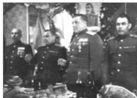
Hotel Lichtág – recepcce generality Rudé armády na oslavu vítězství. Květen 1945

Hotel Lichtág se svou vinárnou a restaurací měl výjimečné postavení. V restauraci se mluvilo polohlasem, podél zdí byly plyšové fotely, vytváře-