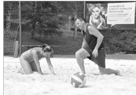
Vítězné turnaje při hledání vody

Děkujeme sponzorům, bez kterých by se turnaj neobešel. Jsou to MIRO Borová, Bartoš s.r.o. - reklama, Sezam Chrudim, Kovoslužba