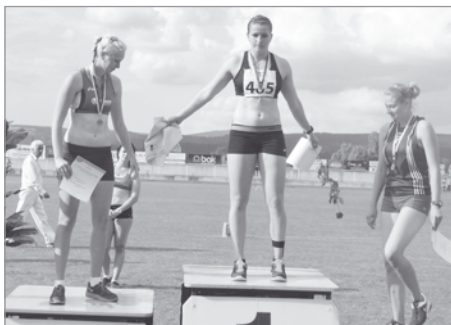
Tři nejúspěšnější oštěpařky